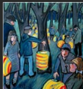
Laternenfest 66 x 66 cm