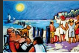
Strandvergnügen 48 x 36 cm