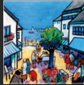
Colonnaden 49 x 49 cm