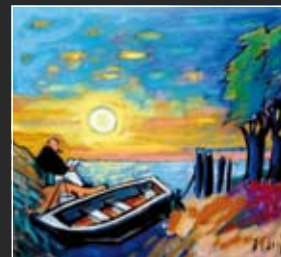
Stille 54 x 50 cm