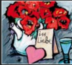
In Liebe 36 x 36 cm