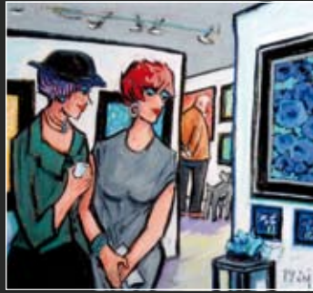
Galerie Heiligendamm 57 x 57 cm