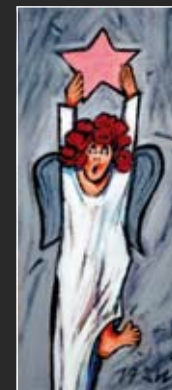
Lebe hoch 28 x 50 cm