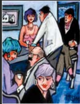
Hafenbar 48 x 56 cm