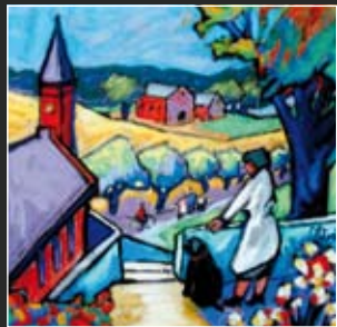
Kirchdorf 50 x 50 cm