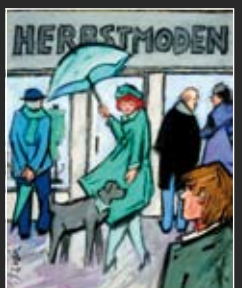
Herbstmoden 39 x 46 cm