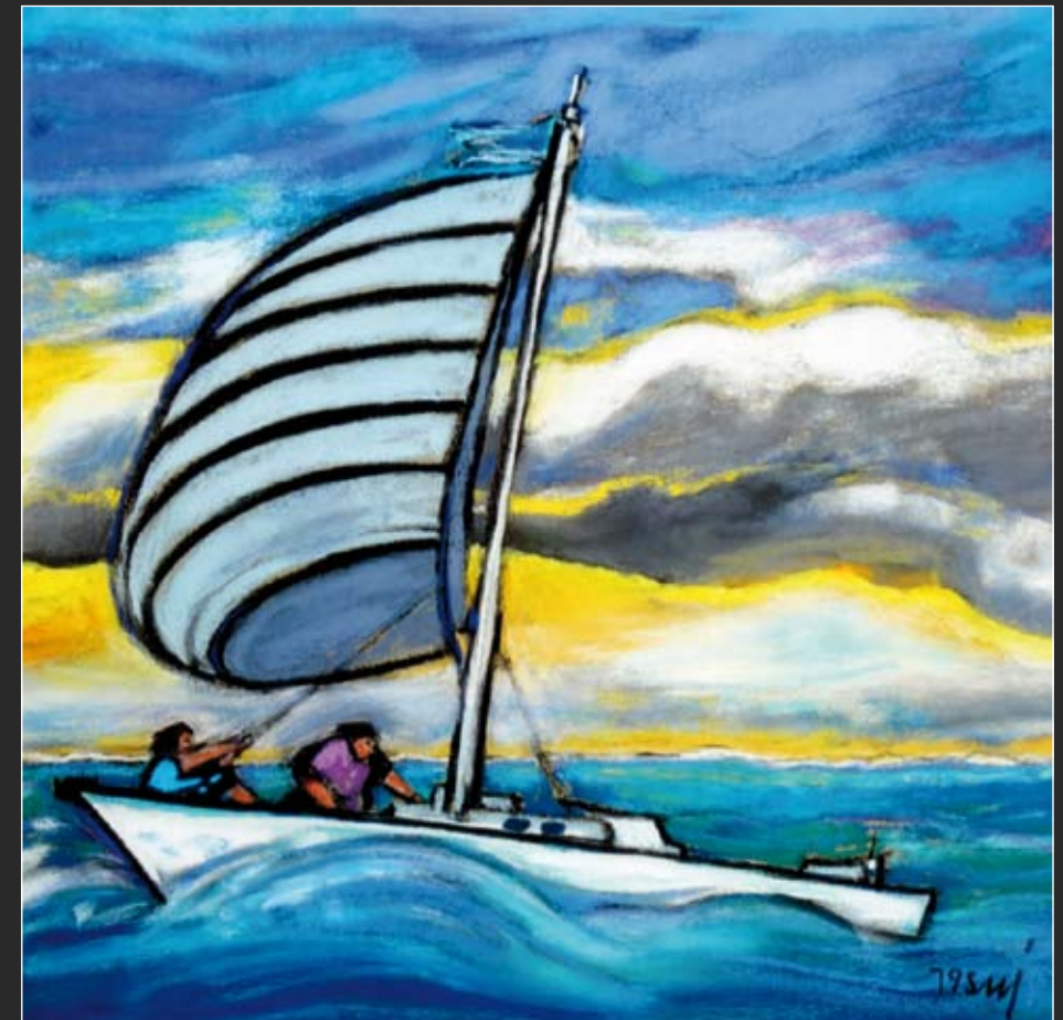
Vorm Wind 56 x 56 cm Original in Lagesbüttel erstellt