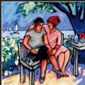
Irma mit Leo 70 x 70 cm