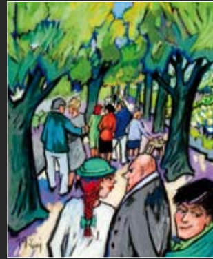
Lindenpark 62 70 cm