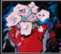
Rosa-rot 36 x 36 cm