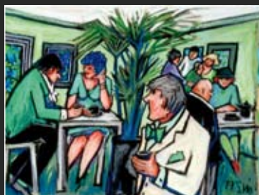
Café Grün 56 x 46 cm