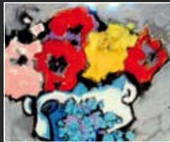
Prachtstücke 37 x 33 cm