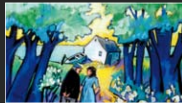
Bootshaus 62 x 43 cm