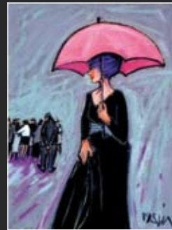
Diva 42 x 52 cm